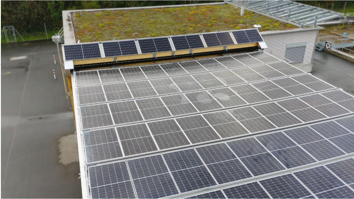
Bild 5: Ansicht von der Urbanbox Demonstrationsanlage mit 6 ausgefahrenen PV-Modulträgern.