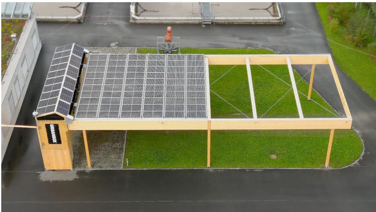
Bild 4: Ansicht von der Urbanbox Demonstrationsanlage mit 6 ausgefahrenen PV-Modulträgern.