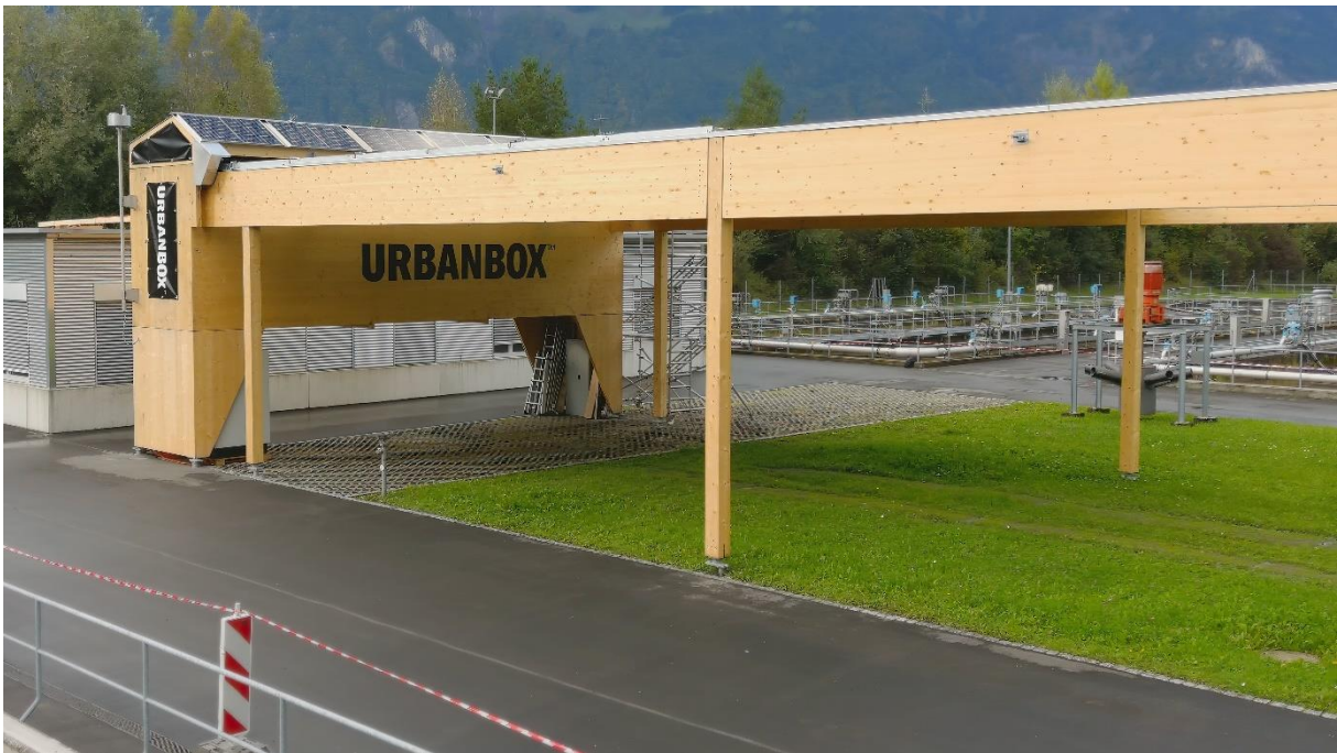
Bild 6: Ansicht von der Urbanbox Demonstrationsanlage mit 6 ausgefahrenen PV-Modulträgern (Bild: Iworks AG).